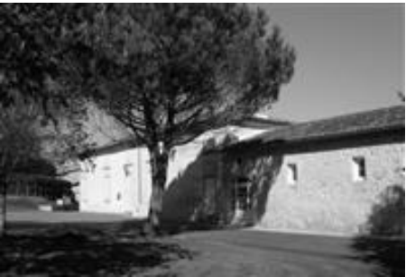
Restaurant de la gare d'Espiet